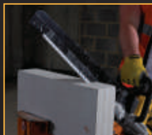
Cemento cellulare (Gasbeton) / Ytong