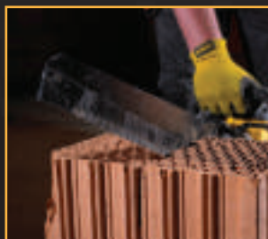
Argilla alleggerita (Poroton)